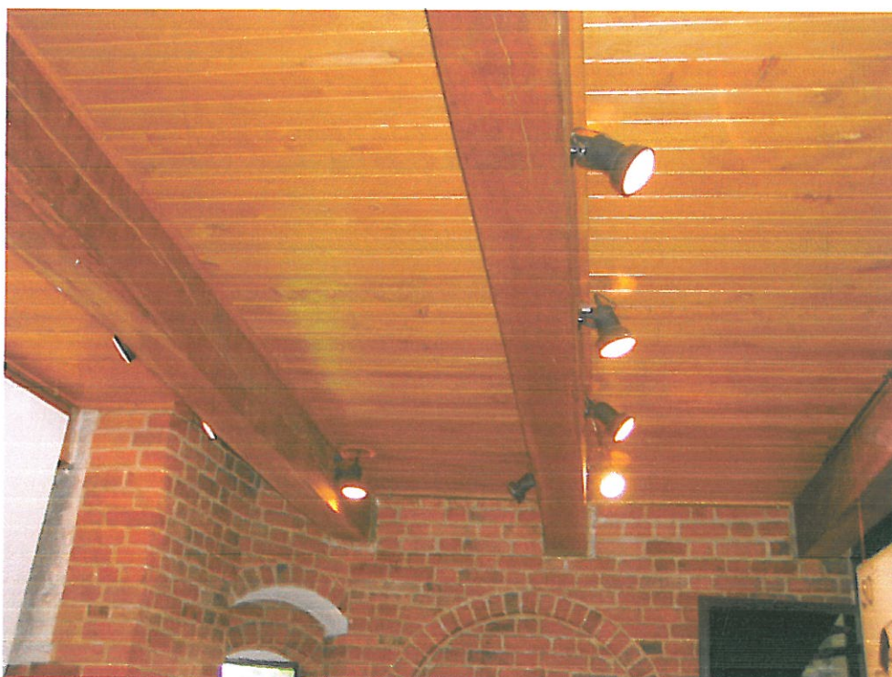
Zdjęcie 7. Widok ogólny stropu drewnianego.