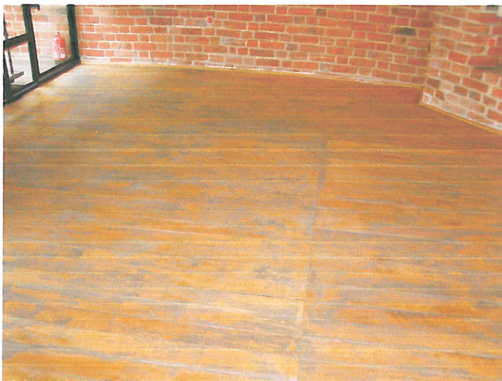
Zdjęcie 6. Widok ogólny zniszczonej podłogi drewnianej.